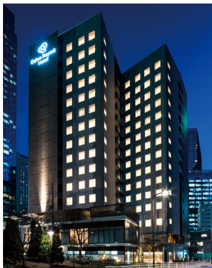
ダイワロイネットホテル西新宿 PREMIER