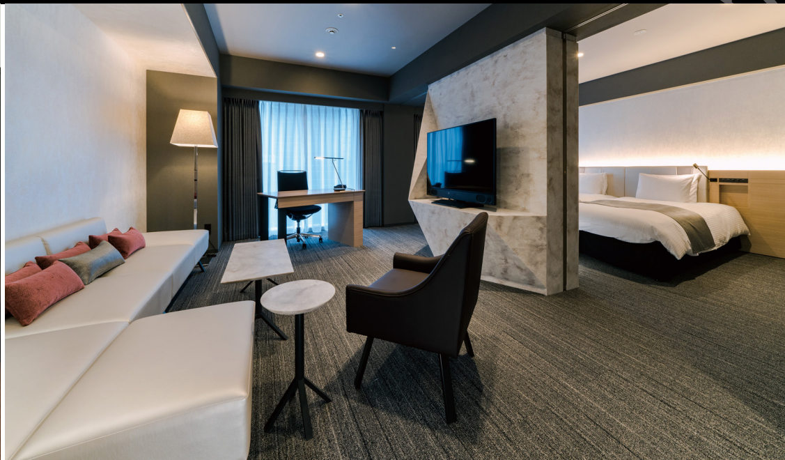
ジュニアスイート (49m 2 )