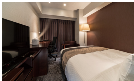
レディースダブル (21m 2 )

全客室ともバス・トイレ別のセパレートタイプ。ゆったりとしたバスタイムをお楽しみいただけます。 複数名でのご宿泊時も、気兼ねなくご利用可能です。