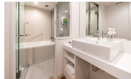
セパレートタイプのバスルーム(一例)

全客室ともバス・トイレ別のセパレートタイプ。ゆったりとしたバスタイムをお楽しみいただけます。 複数名でのご宿泊時も、気兼ねなくご利用可能です。