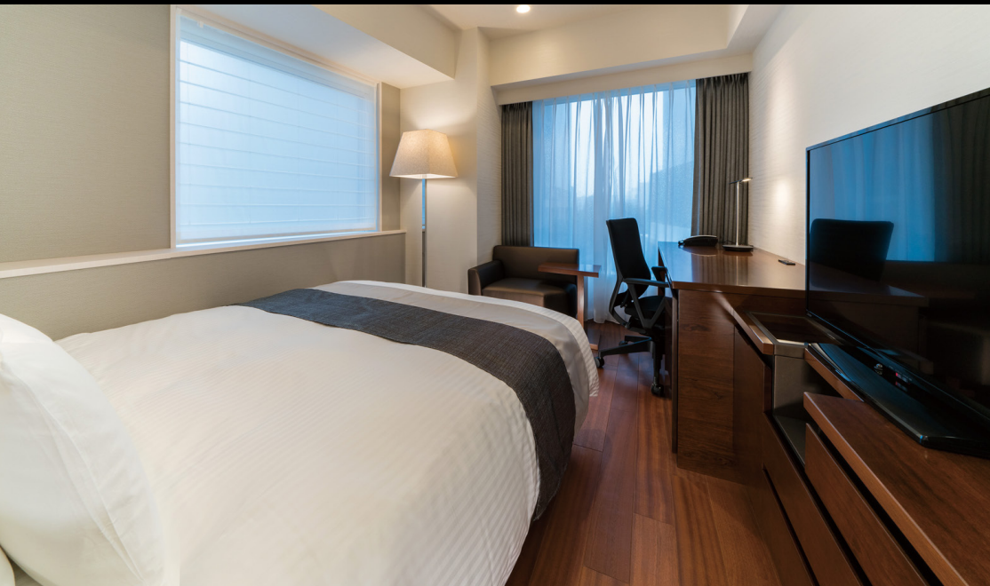
スタンダードダブル (21m 2 )