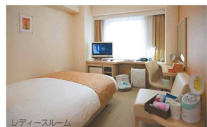
レディースルーム