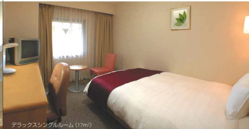
デラックスシングルルーム(17㎡)