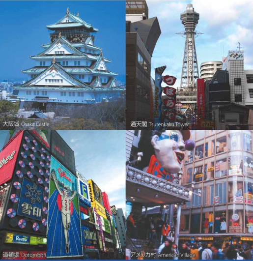
大阪城 Osaka Castle 通天閣 Tsutenkaku Tower 道頓堀 Dotombori アメリカ村 American Village

大阪城：地下鉄 本町一駅/徒歩(5分) 通天閣：地下鉄 心斎橋 - 動物園前(6分) → 徒歩(10分) 道頓堀(戎橋)：ホテル → 徒歩(15分) アメリカ村：ホテル → 徒歩(10分)