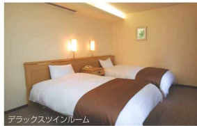
デラックスツインルーム