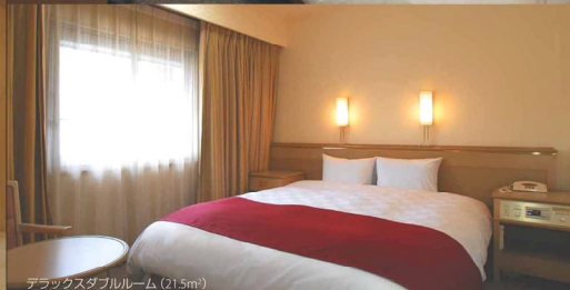
デラックスダブルルーム(21.5㎡)