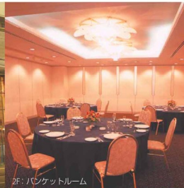
2F:バンケットルーム