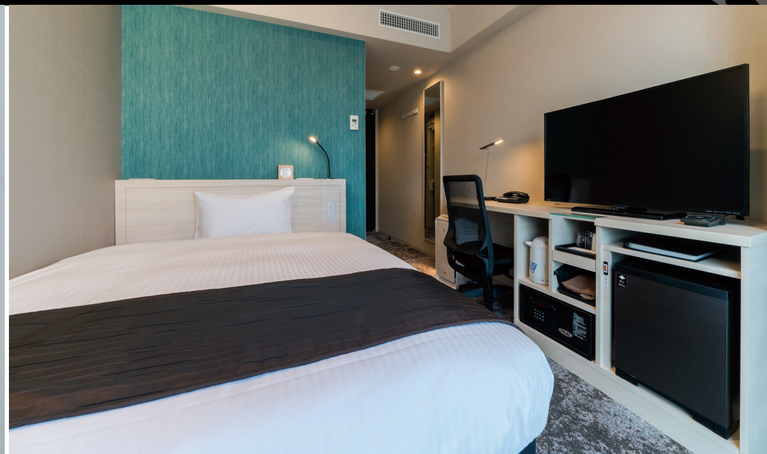
スタンダード - スマート - (15m 2 )