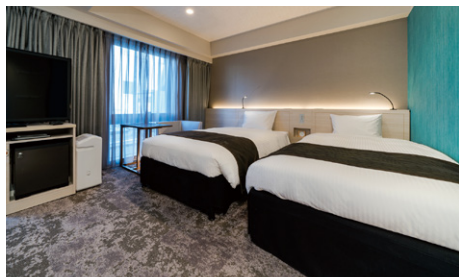
ツイン (21m 2 )