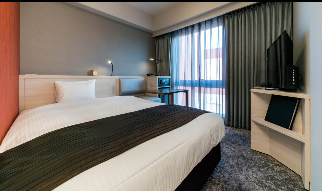
スタンダード - ベーシック - (15m 2 )