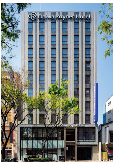
DEL style 福岡西中洲