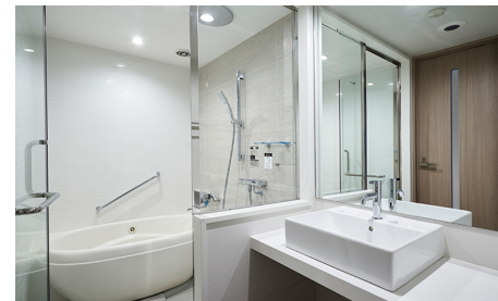
セパレートタイプのバスルーム(一例)

ユニバーサルを除く全室バス・トイレ別のセパレートタイプで、ゆったりとしたバスタイムをお楽しみいただけます。複数名までのご宿泊時も、気兼ねなくご利用可能です。