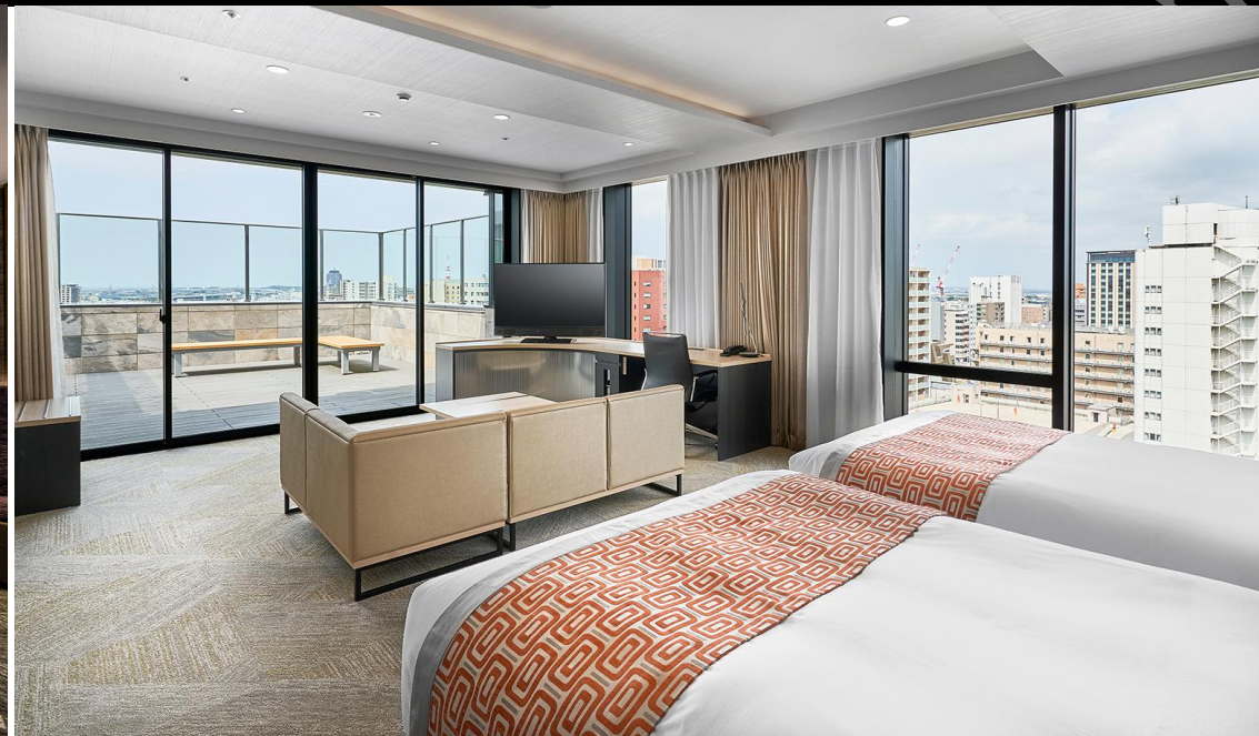
ペントハウス・ジュニアスイート (50m 2 )