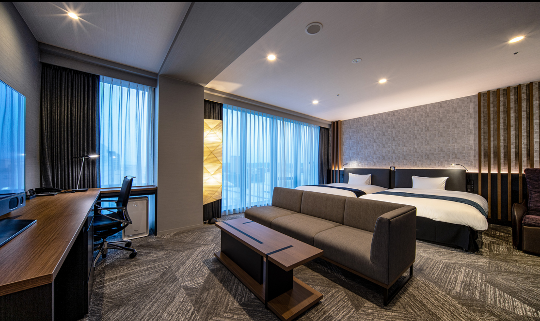
ジュニアスイート・フォース (50m 2 )