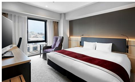
デラックスダブル (27m 2 )