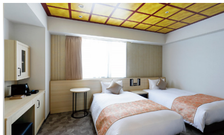
スタンダードツイン (25.38m 2 )