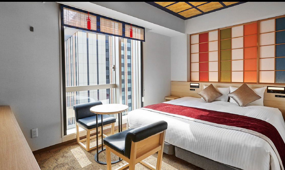
コンセプトダブル (23.76m 2 )