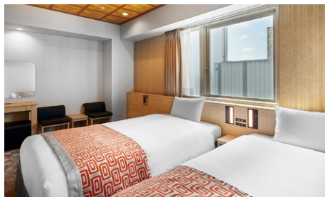
スーペリアツイン (25.85m 2 )