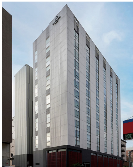
ダイワロイネットホテル金沢 MIYABI