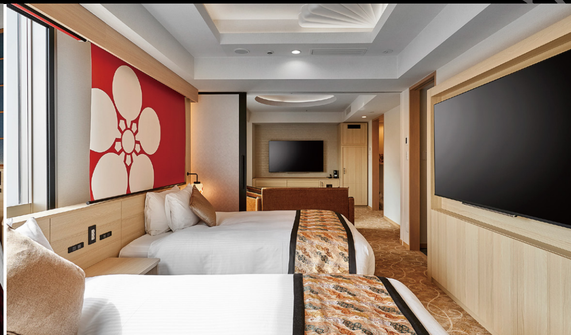
スイート (45.19m 2 )