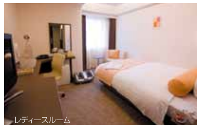
レディースルーム