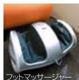
フットマッサージャー