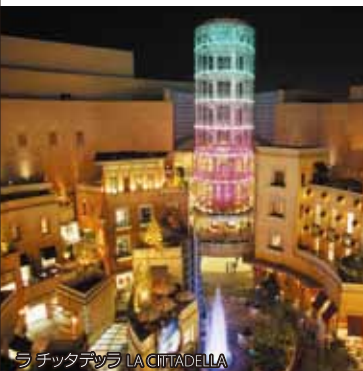
ラ チッタテッラ LA CITADELLA