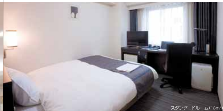
スタンダードルーム(18㎡)