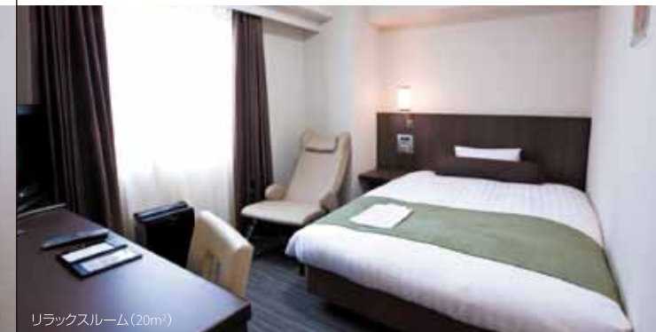
リラックスルーム(20㎡)