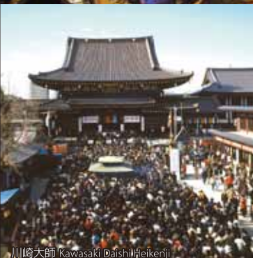
川崎大師 Kawasaki Daishi Heikenji