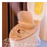
イオン フェイススチーマー