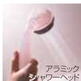
アラミック シャワーヘッド