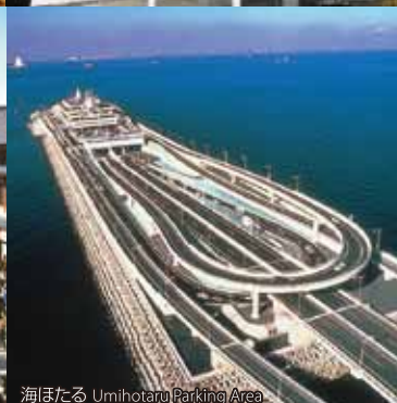
海ほたる Umihotaru Parking Area

ラ チッタテッラ：ホテル → 徒歩(約1分) ラゾーナ川崎：ホテル → 徒歩(約5分) 川崎大師：京急大師線 京急川崎 - 川崎大師(約5分) 海ほたる：首都高川崎線 殿町IC → 車(約30分)