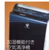
加湿機能付き 空気清浄機