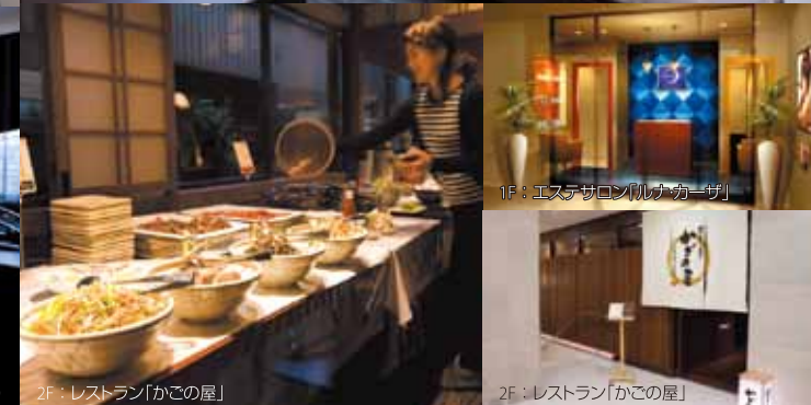
2F: レストラン「かごの屋」