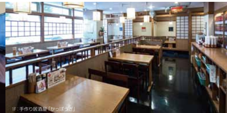
1F: 手作り居酒屋「かっぽうぎ」