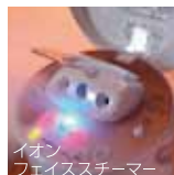
イオンフェイススチーマー