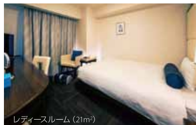
レディースルーム (21m²)