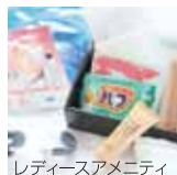
レディースアメニティ