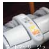
フットマッサージャー