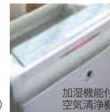
加湿機能付空気清浄機