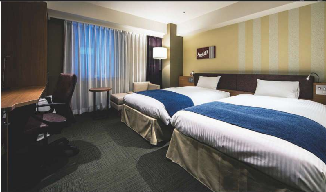
コーナーツイン (28.2m 2 )