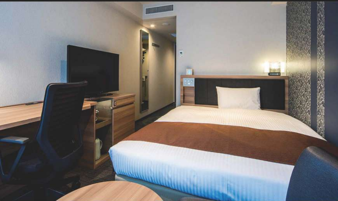
スタンダードダブル (18.2m 2 )