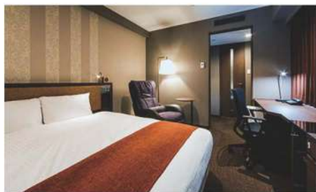
スーペリアダブル (20.15~20.85m 2 )