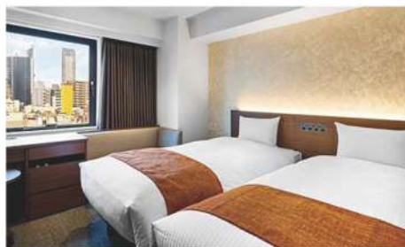
コンパクトツイン (20m 2 )