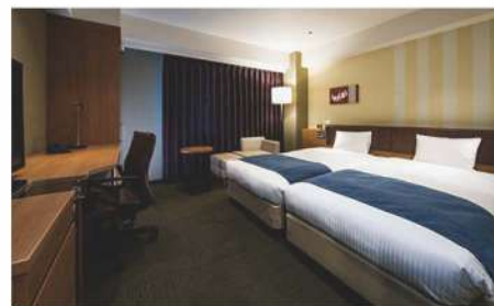
ハリウッドツイン (26.9m 2 )