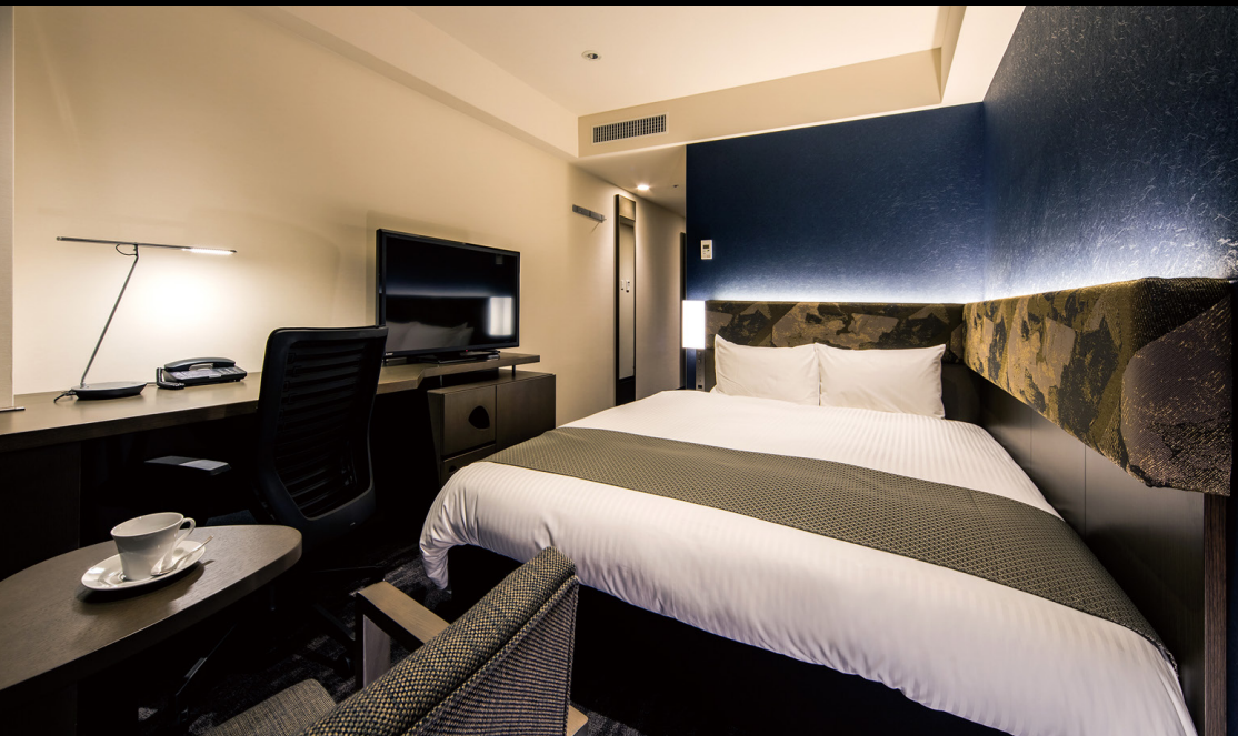
スーペリアダブル (20.1m 2 )