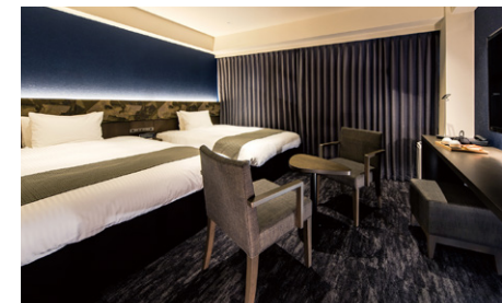
デラックスツイン (30.9m 2 )

他にエグゼクティブダブル(40.1m 2 )、ユニバーサルダブル(23.9m 2 )のお部屋がございます。 (全205室)