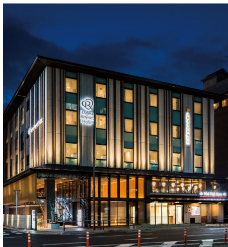
ダイワロイネットホテル 京都駅前 PREMIER