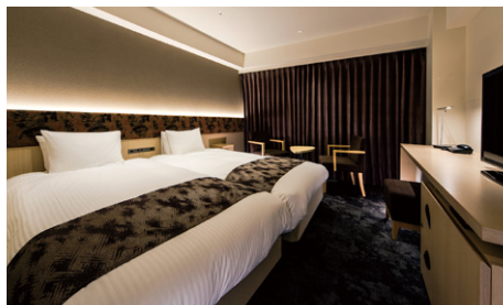
スタンダードツイン (23.7m 2 )