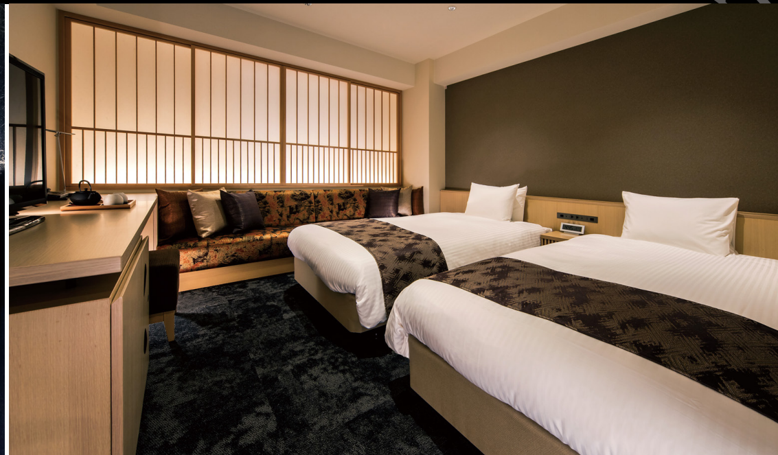
スーペリアツイン～雅(みやび)～ (24～26.6m 2 )