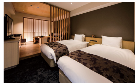
エグゼクティブツイン～華(はな)～ (36.2m 2 )