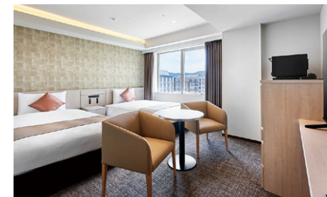
デラックスツイン (28m 2 )

他にツイン (23m 2 )、ビジネス (18m 2 ) のお部屋がございます。