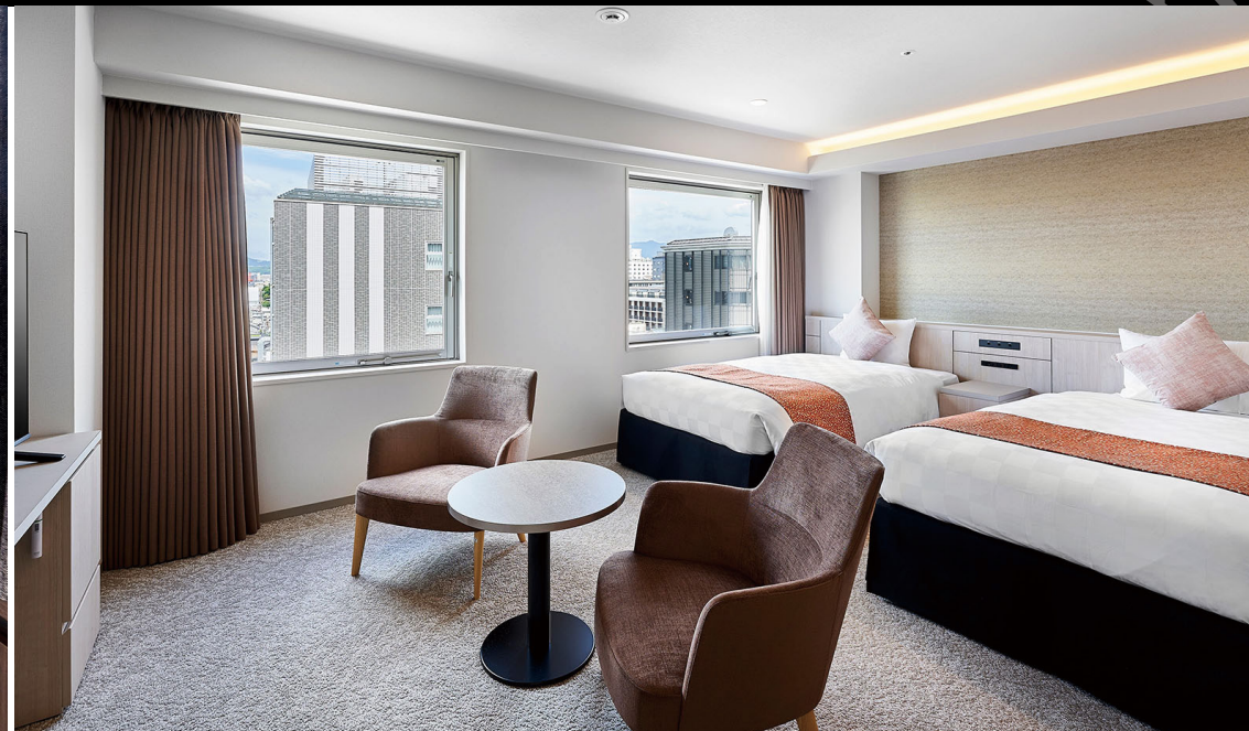
ワイドデラックスツイン (36m 2 )