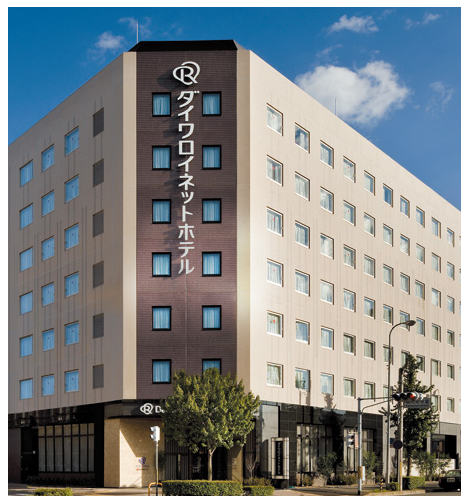
ダイワロイネットホテル京都八条口