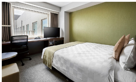
スーペリア (20m 2 )