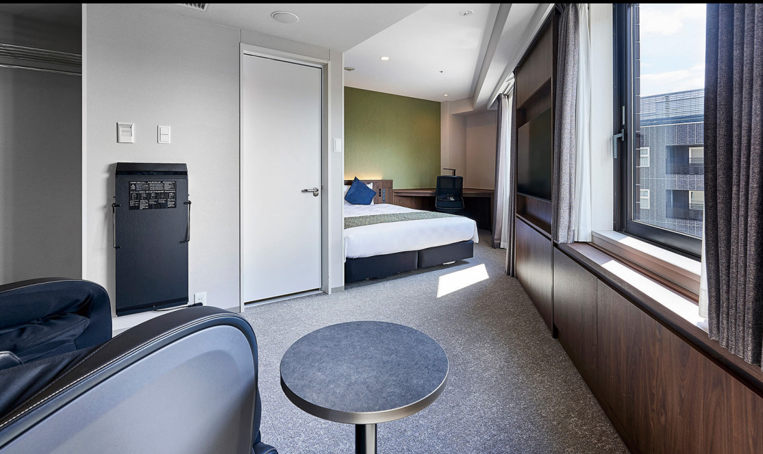
デラックスダブル (26m 2 )