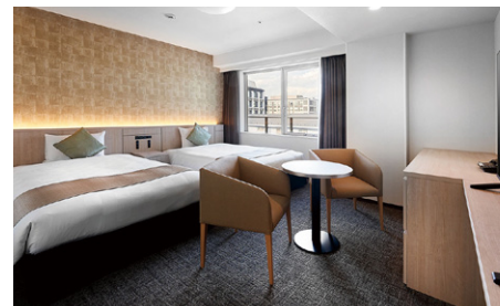
ユニバーサルツイン (28m 2 )