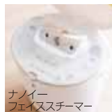
ナノイーフェイススチーマー