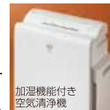
加湿機能付き空気清浄機