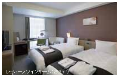
レディースツインルーム(23.3㎡)