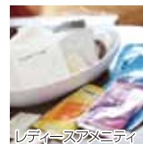
レディースアメニティ