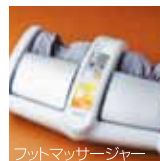
フットマッサージャー