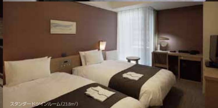
スタンダードツインルーム(23.8㎡)