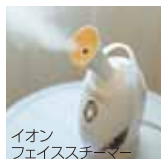
イオンフェイススチーマー