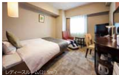
レディースルーム(21.5m²)