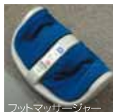
フットマッサージャー