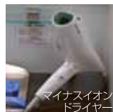
マイナスイオンドライヤー