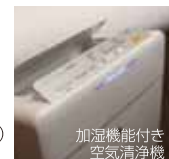
加湿機能付き空気清浄機