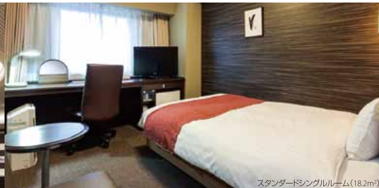
スタンダードシングルルーム(18.2m²)