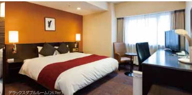
デラックスダブルルーム(26.7m²)