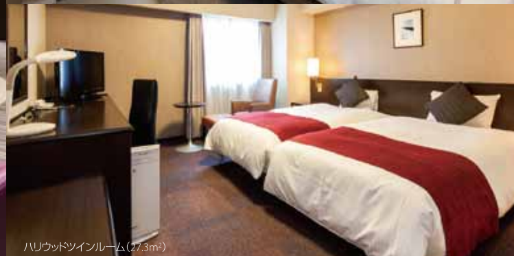
ハリウッドツインルーム(27.3m²)