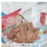
レディーススパミニティ