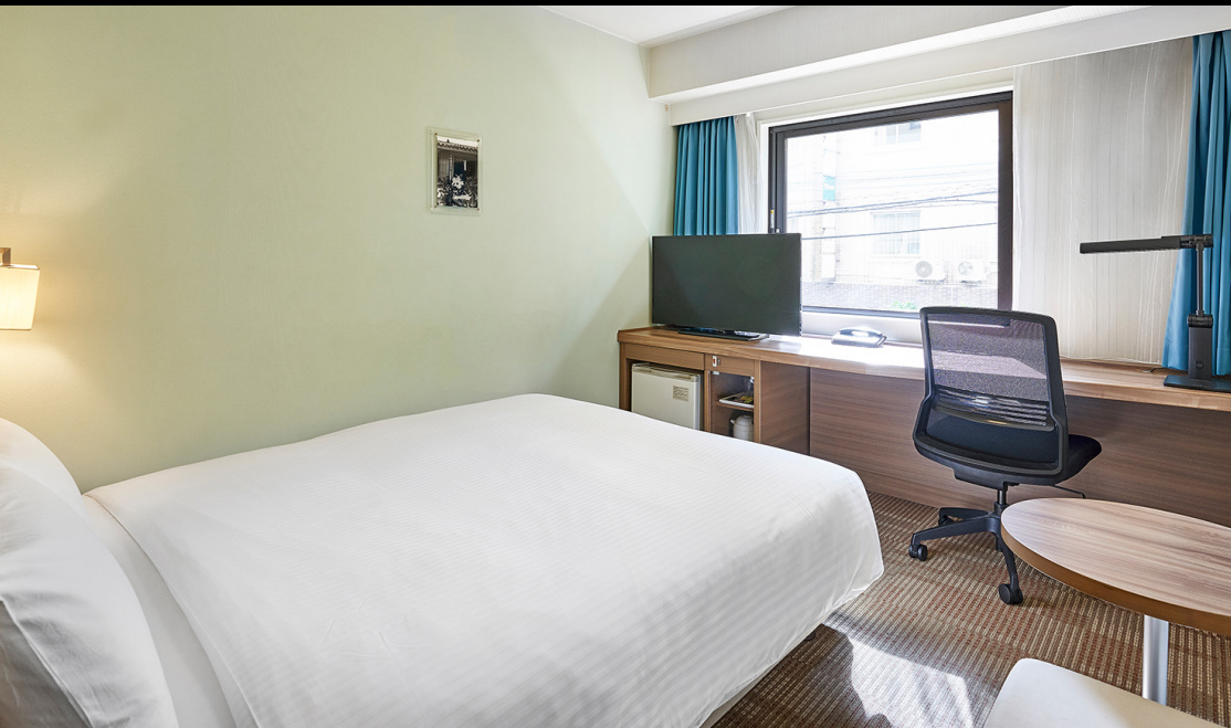
スタンダード (16.5~18m 2 ) 本館