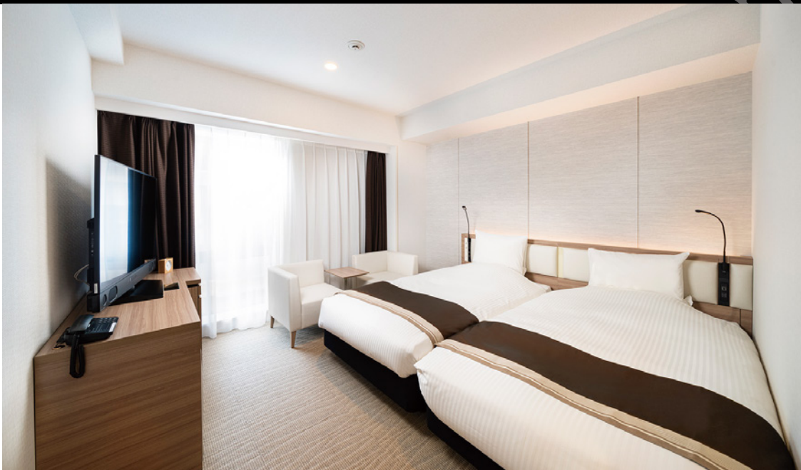
モデレートツイン (26.6m 2 ) 別館