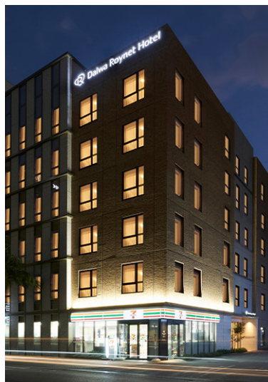
ダイワロイネットホテル沖縄県庁前