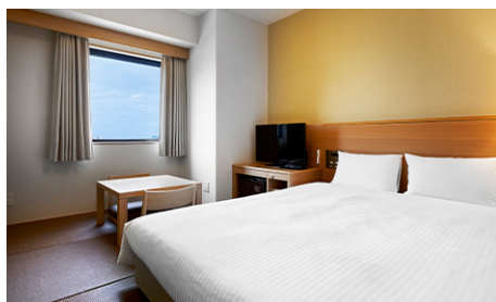
リラックス(和洋室) (19m 2 ) 本館