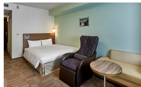
ユニバーサル (25.5m 2 ) 本館