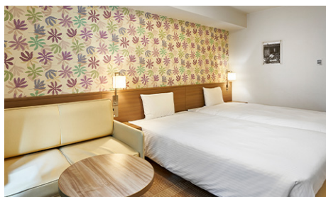
ハリウッドツイン (25.5m 2 ) 本館