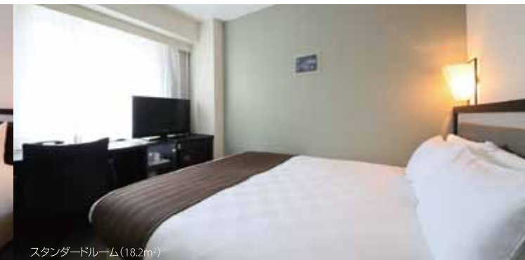
スタンダードルーム(18.2m 2 )