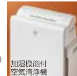
加湿機能付空気清浄機