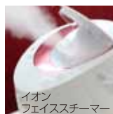
イオンフェイススチーマー