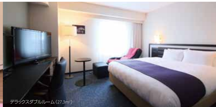
デラックスダブルルーム(27.3m 2 )