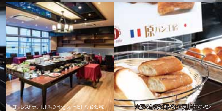
2F: レストラン「北浜 Dining Su-mie」(朝食会場)