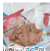
レディースアメニティ