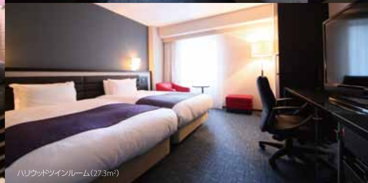
ハリウッドツインルーム(27.3m 2 )