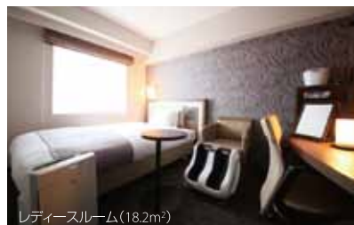
レディースルーム(18.2m 2 )