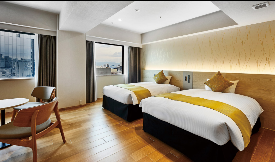
スタイルツイン (38.4m 2 )