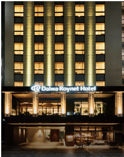
DEL style 大阪心斎橋