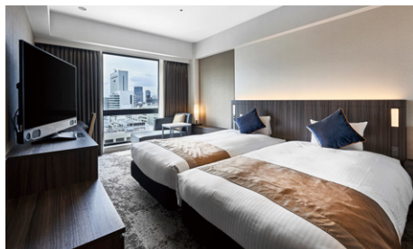
ハリウッドツイン (26.4m 2 )

ユニバーサルを除きバス・トイレ別のセパレートタイプ。ゆったりとしたバスタイムをお楽しみいただけます。複数名でのご宿泊時も、気兼ねなくご利用可能です。