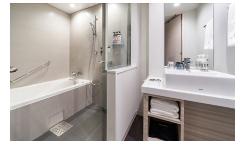
セパレートタイプのバスルーム(一例)

ユニバーサルを除きバス・トイレ別のセパレートタイプ。ゆったりとしたバスタイムをお楽しみいただけます。複数名でのご宿泊時も、気兼ねなくご利用可能です。