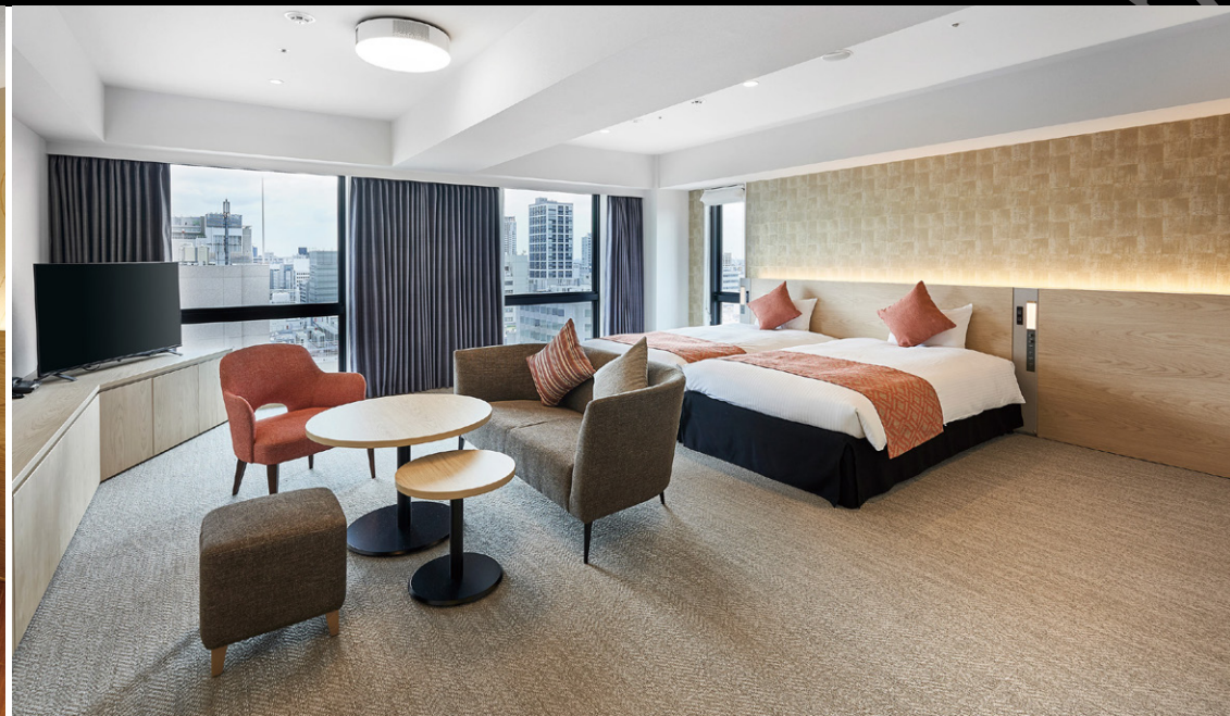
ジュニアスイート (52.9m 2 )