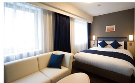
モデレート (21m 2 )