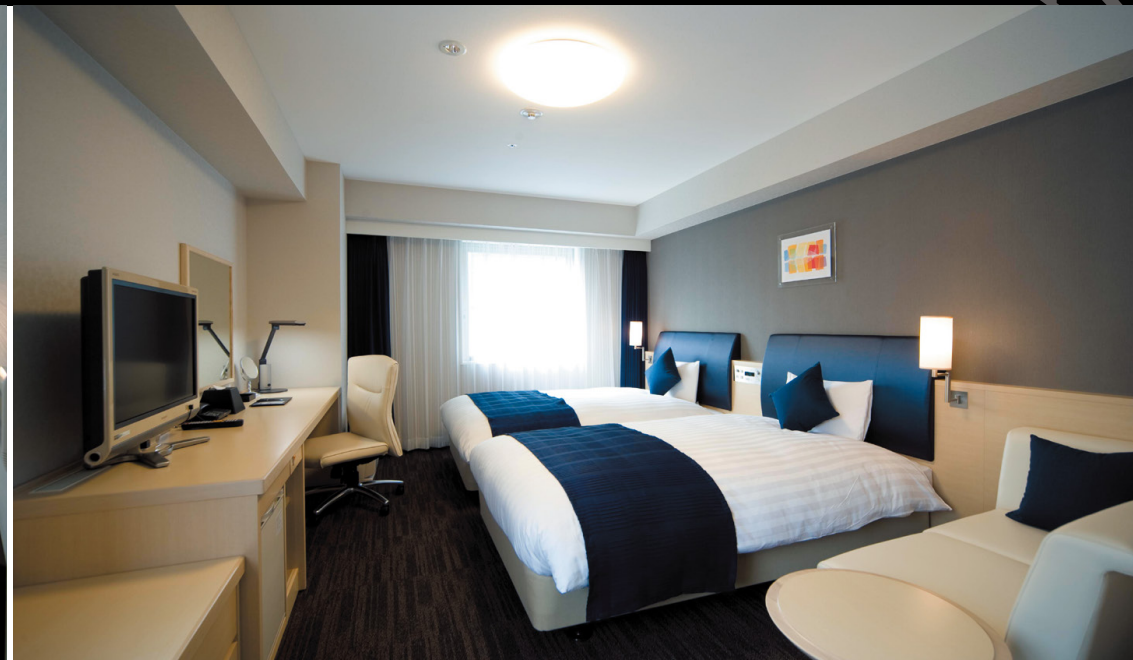
ツイン (30m 2 )