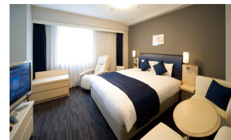
デラックス (32m 2 )