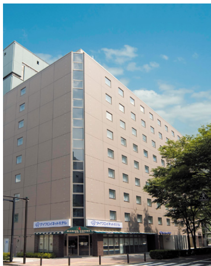
ダイワロイネットホテル 新横浜