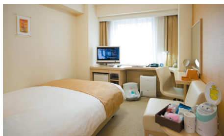
レディース (20m 2 )