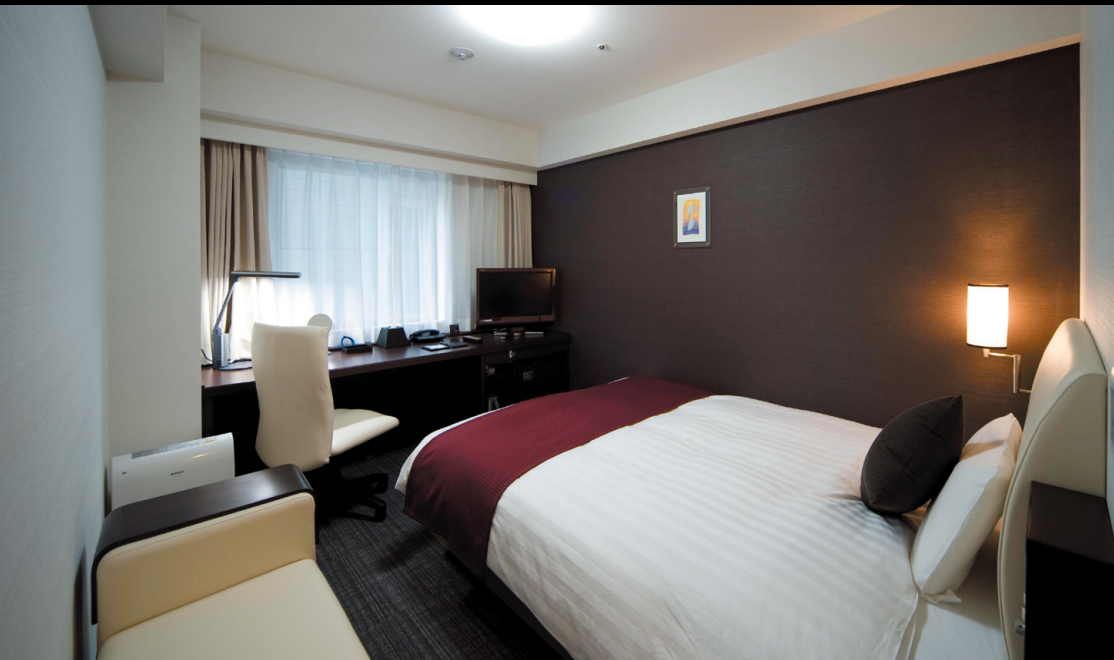
スタンダード (18m 2 )