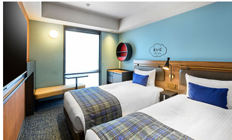
スタンダードツイン (18.48m 2 )