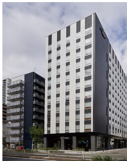
DEL style 大阪新梅田