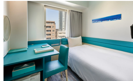
スマートシングル (11.3m 2 ) 別館