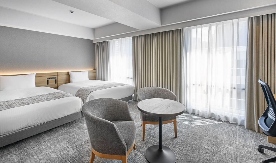
デラックスツイン (36m 2 )