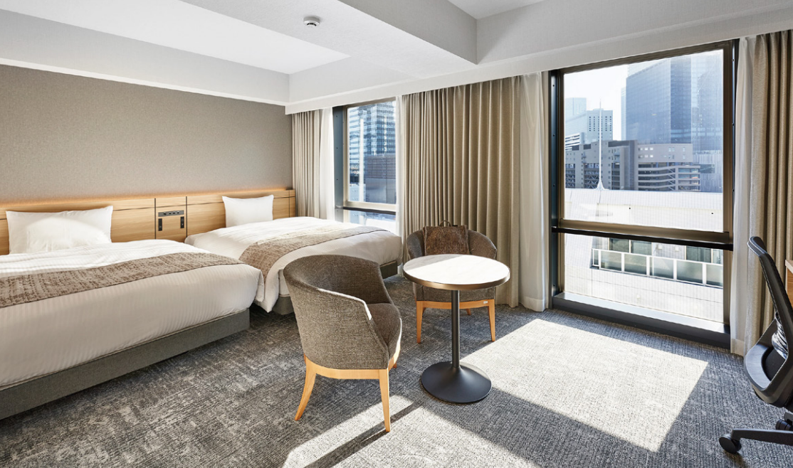
デラックスツイン (36m 2 )