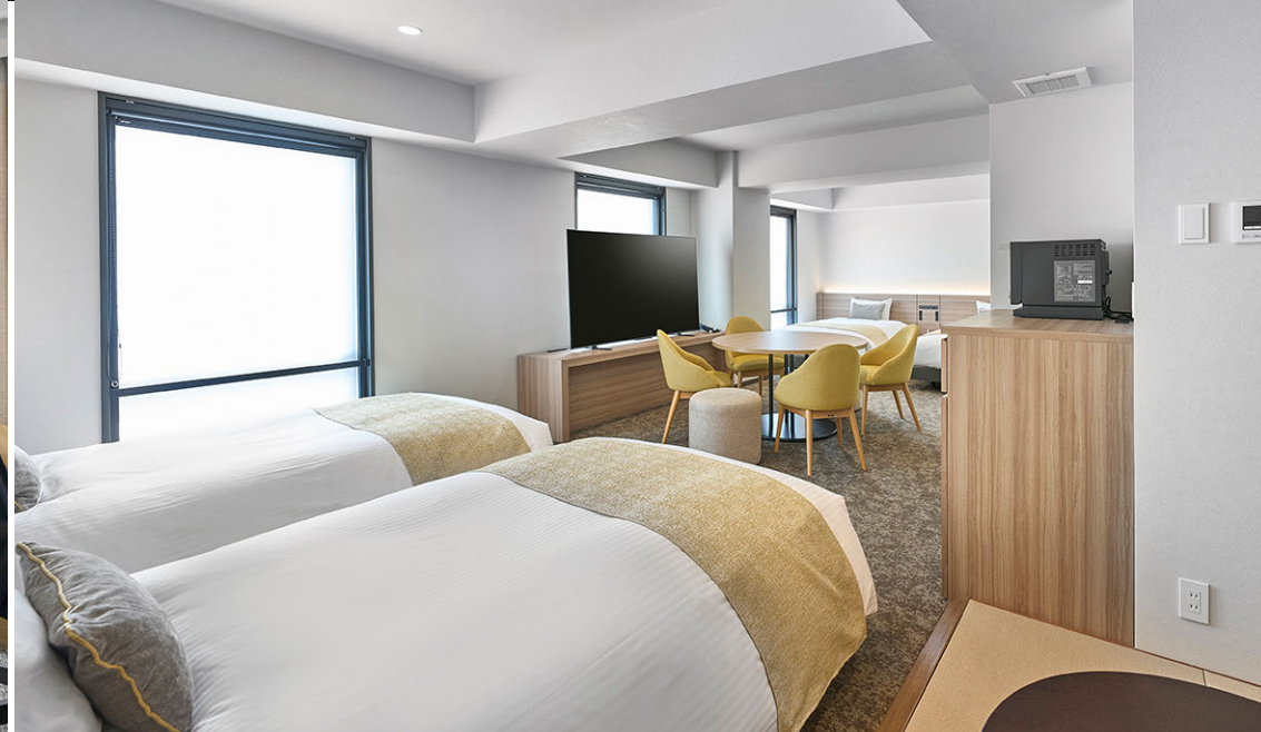
ファミリーフォース (54m 2 )