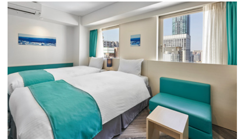
スマートツイン (22.5m 2 ) 別館

他にプレミアムビジネス (18.48m 2 )、ハリウッドツイン (19.47~20.13m 2 )、スタンダードトリプル (27.51m 2 )、ユニバーサルトリプル (35.89m 2 ) 等のお部屋がございます。 (全365室)