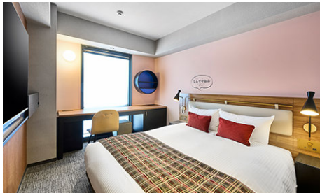
スタンダードダブル (18.48m 2 )