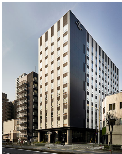
DEL style 大阪新梅田