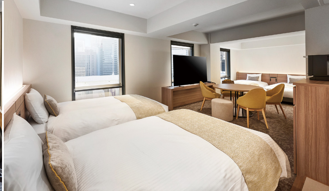
ファミリーフォース (54m 2 )