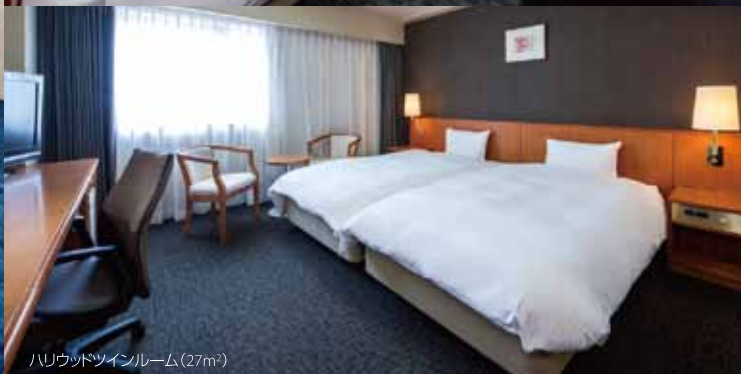
ハーフツインルーム(27㎡)