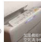
加湿機能付空気清浄機