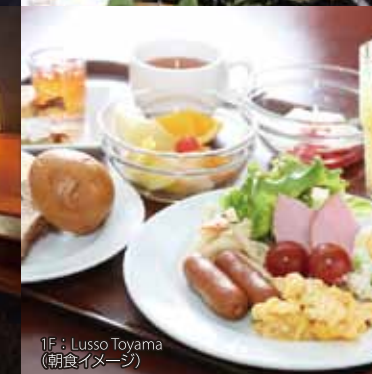
1F: Lusso Toyama(朝食イメージ)