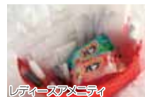
レディースアメニティ

女性のお客様には入浴剤やコットン、ヘアバンド等を、お子様には子供用歯ブラシやスリッパをご用意しています。