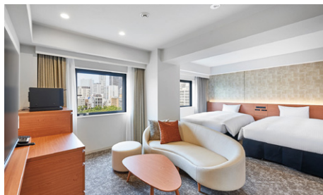
デラックスツイン (32m 2 )