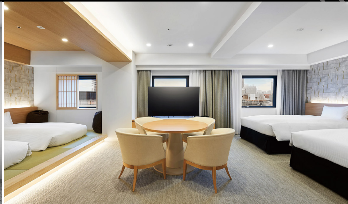
ジュニアスイート (52m 2 )