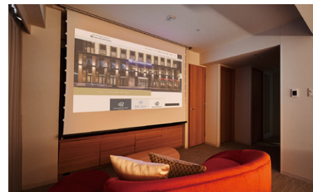
シアターツイン (36m 2 )