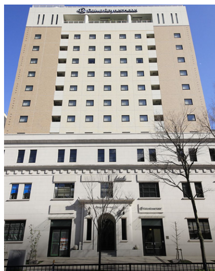
ダイワロイネットホテル横浜公園