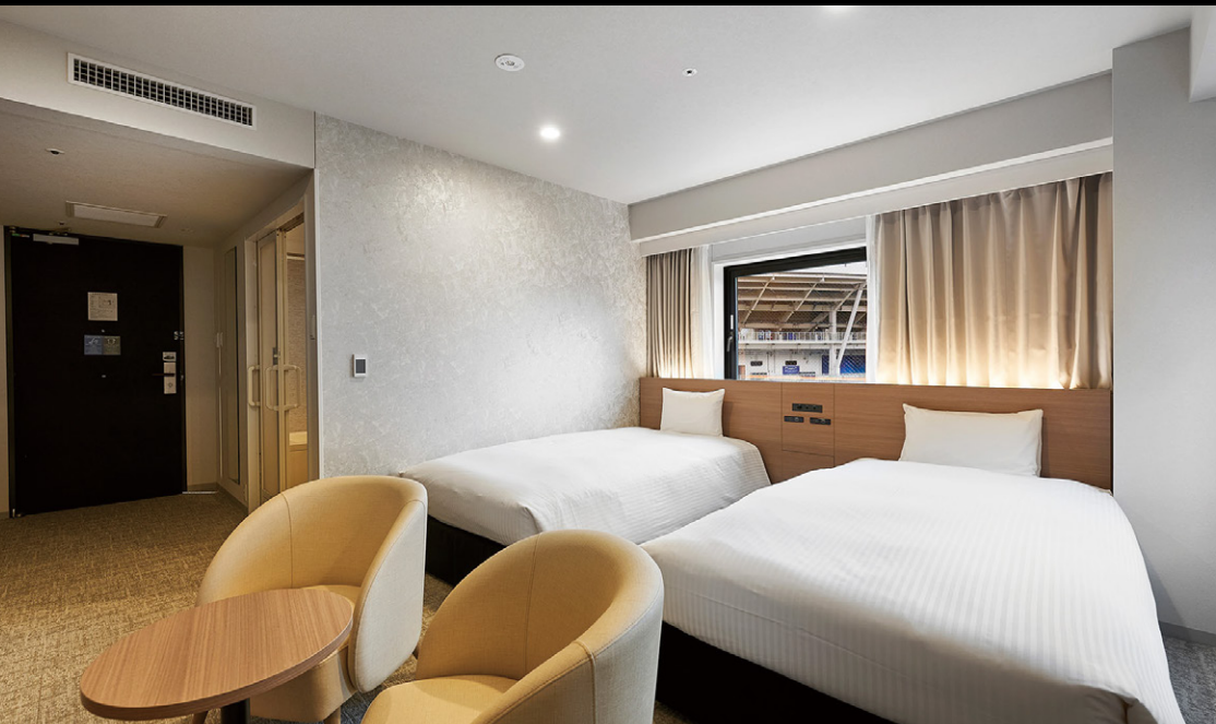
スタンダードツイン (27m 2 )