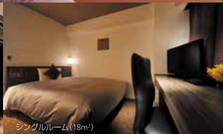
シングルルーム(18m 2 )