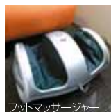
フットマッサージャー