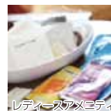
レディースアメニティ