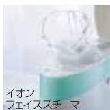
イオンフェイススチーマー