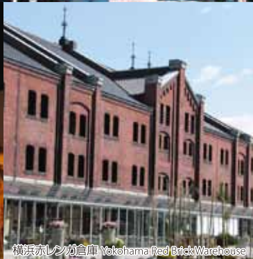
横浜赤レンガ倉庫 Yokohama Red Brick Warehouse

八景島シーパラダイス：JR 関内 - シーサイドライン 八景島(約35分) 横浜中華街：ホテル → 徒歩(約5分) 開港記念会館：ホテル → 徒歩(約8分) 横浜赤レンガ倉庫：ホテル → 徒歩(約15分)