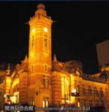
開港記念会館 Port Opening Memorial Hall