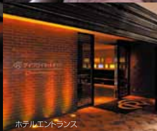
ホテルエントランス