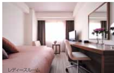
レディースルーム