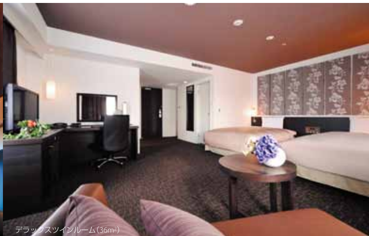
デラックスツインルーム(36m 2 )