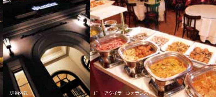
1F:「アクイラ・ウォランス」