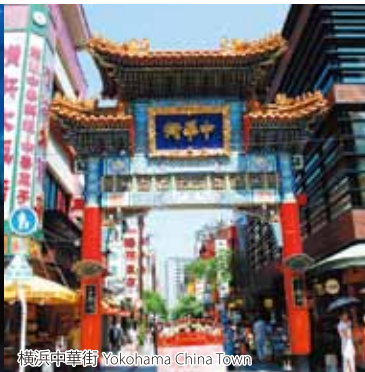
横浜中華街 Yokohama China Town