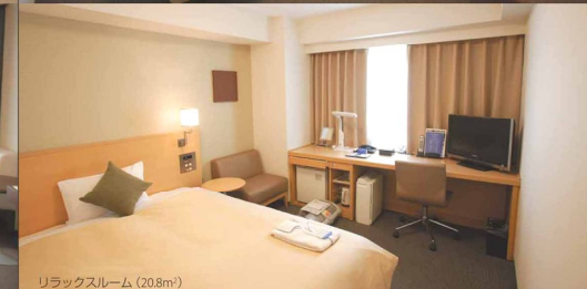
リラックスマーム (20.8m²)