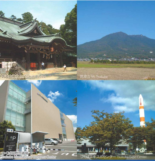
筑波山・筑波山神社：ホテル→車またはバス（約40分） つくば国際会議場：ホテル→徒歩（約10分） つくばエキスポセンター：ホテル→徒歩（約5分）